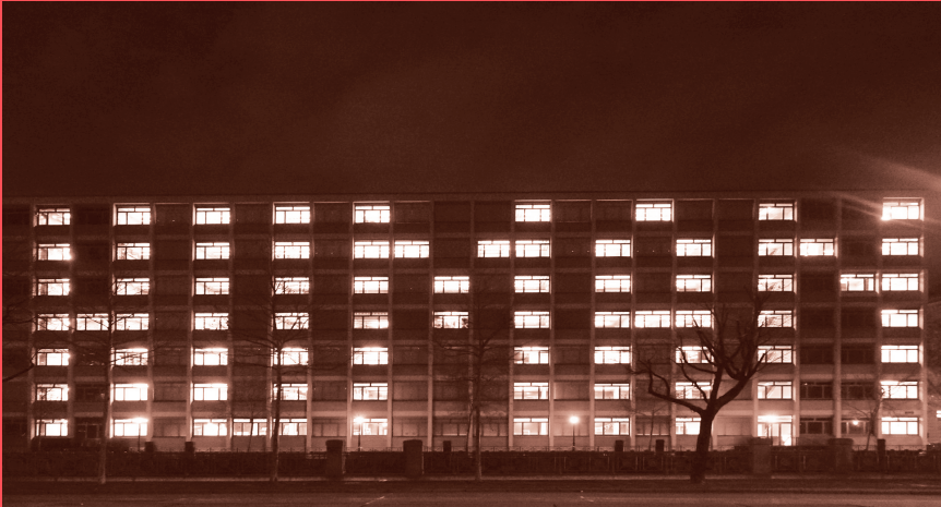
Licht-Kunst-Signal Human 2019, Installationsansicht der Interaktionsreihe HUMAN