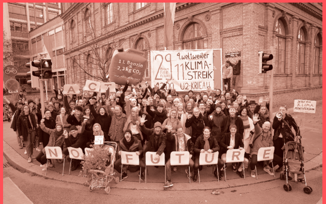
Mitarbeiter_innen und Studierende der Angewandten beim 4. weltweiten Klimastreik am 29. November 2019 © eSeL ( https://esel.at )