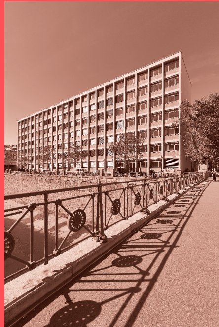
Schwanzer-Trakt am Oskar-Kokoschka-Platz