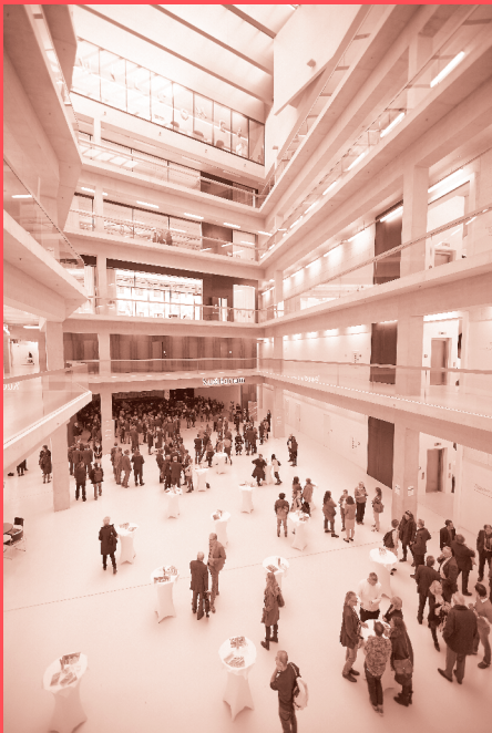
Expositur VZA7 in der Vorderen Zollamtsstraße