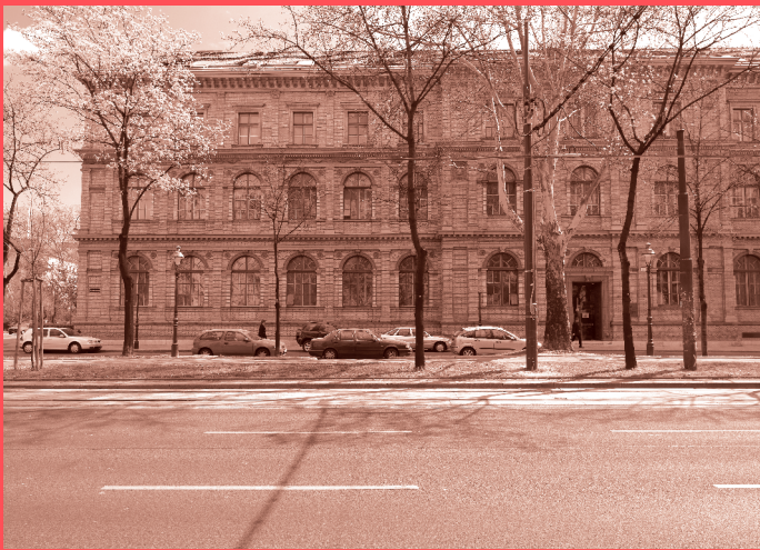
Ferstel-Trakt am Stubenring / Oskar-Kokoschka-Platz